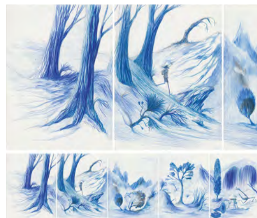
Estudi de paisatge Lleida, novembre 2022

5 fulles de 21 x 29,7 cm. Llapis, AquaMonolith sobre paper Projecte "Blau i Bobo"