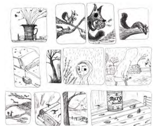
Vinyetes Lleida, 2015

Punta fina Projecte de novel·la gràfica sense títol