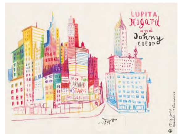
Estudi de ciutat Lleida, març 2020

29,7 x 42 cm. Llapis de colors Projecte "Esperits de Nova York"