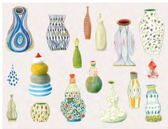
Disseny d'accessoris Lleida, abril 2020

Llapis de colors Projecte "Esperits de Nova York"