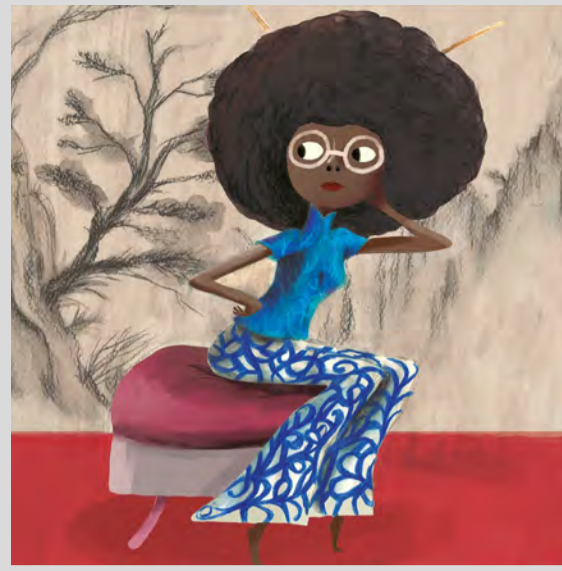
Lupita. Disseny de personatges, Lleida, abril 2021

Viu un present en el qual crea i es recrea lluny de les pressions d'entregues a temps fixat. Definint-se com el seu crític més dur, avui gaudeix del privilegi de dissenyar a foc lent amb el "luxe del temps". I és que la fermesa que dona l'experiència l'empeny a continuar cercant i perfi-