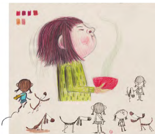
Lixue. Disseny de personatges Lleida, abril 2021

Llapis de colors, tinta i aquarel·la Projecte "Esperits de Nova York"