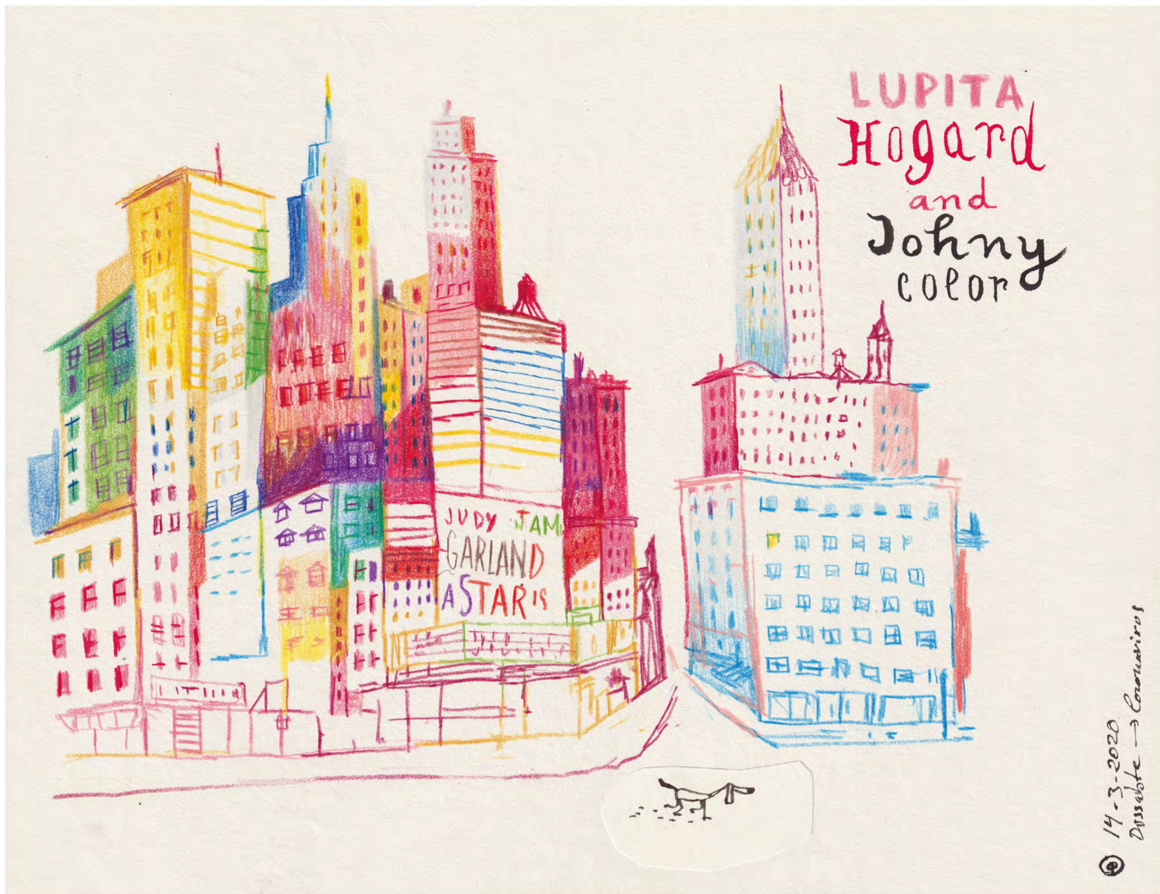
Projecte "Esperits de Nova York"