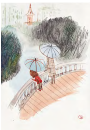
Els dies grisos Lleida, juliol 2019

20,5 x 29,7 cm. Llapis i aquarel·la Projecte "El color dels dies"