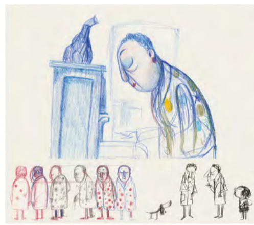
Violeta. Disseny de personatges Lleida, maig 2021

Llapis, llapis de colors i tinta Projecte "Esperits de Nova York"