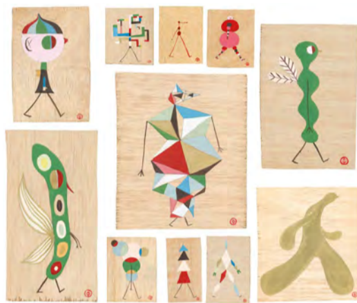
Forty-Five Walkers (selecció) Lleida, setembre 2015