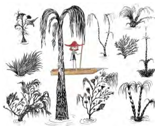
L'aiguamoll. Estudi de paisatge Lleida, setembre 2021

Tinta i aquarel·la Projecte "Blau i Bobo"