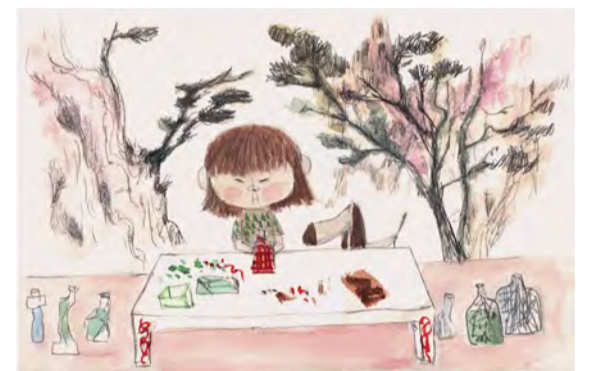
Lixue. Disseny de personatges Lleida, abril 2021

23 x 14,2 cm. Llapis de colors, tinta i aquarel·la Projecte "Esperits de Nova York"