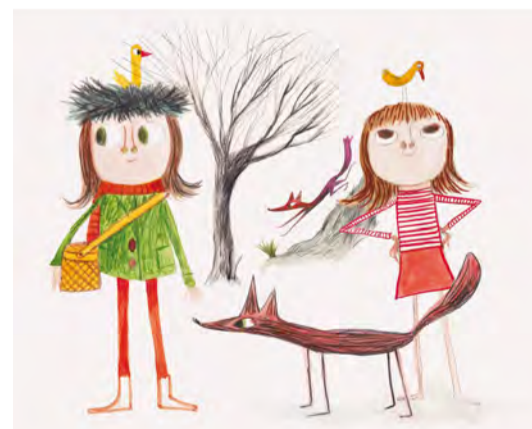
Disseny de personatges Lleida, juliol 2019

Llapis, tinta i aquarel·la Projecte "El color dels dies"